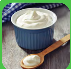
3 CUPS yaourt grec