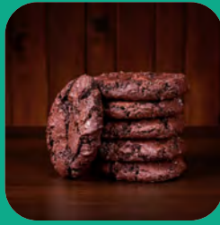
biscuits au chocolat