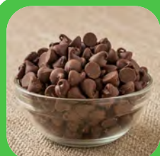
pépites de chocolat