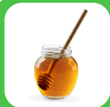
1/2 TASSE miel