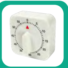
~ 1 min