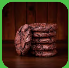
biscuits au chocolat