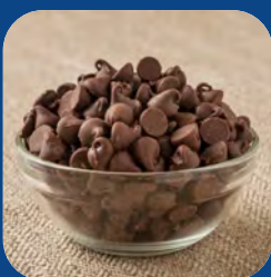
pépites de chocolat