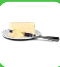
2 TBSP beurre