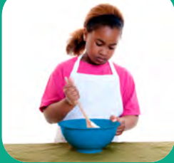
mélange bol #2