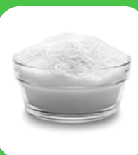
1/4 TASSE sucre