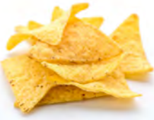
croustilles de maïs