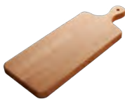
planche à découper